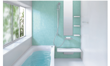
システムバスルームサザナHSシリーズ (1坪サイズ1616Sサイズ)