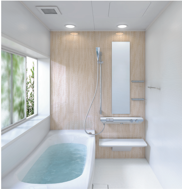
システムバスルーム サザナプレミアムHGシリーズ (1坪サイズ 1616Wタイプ)